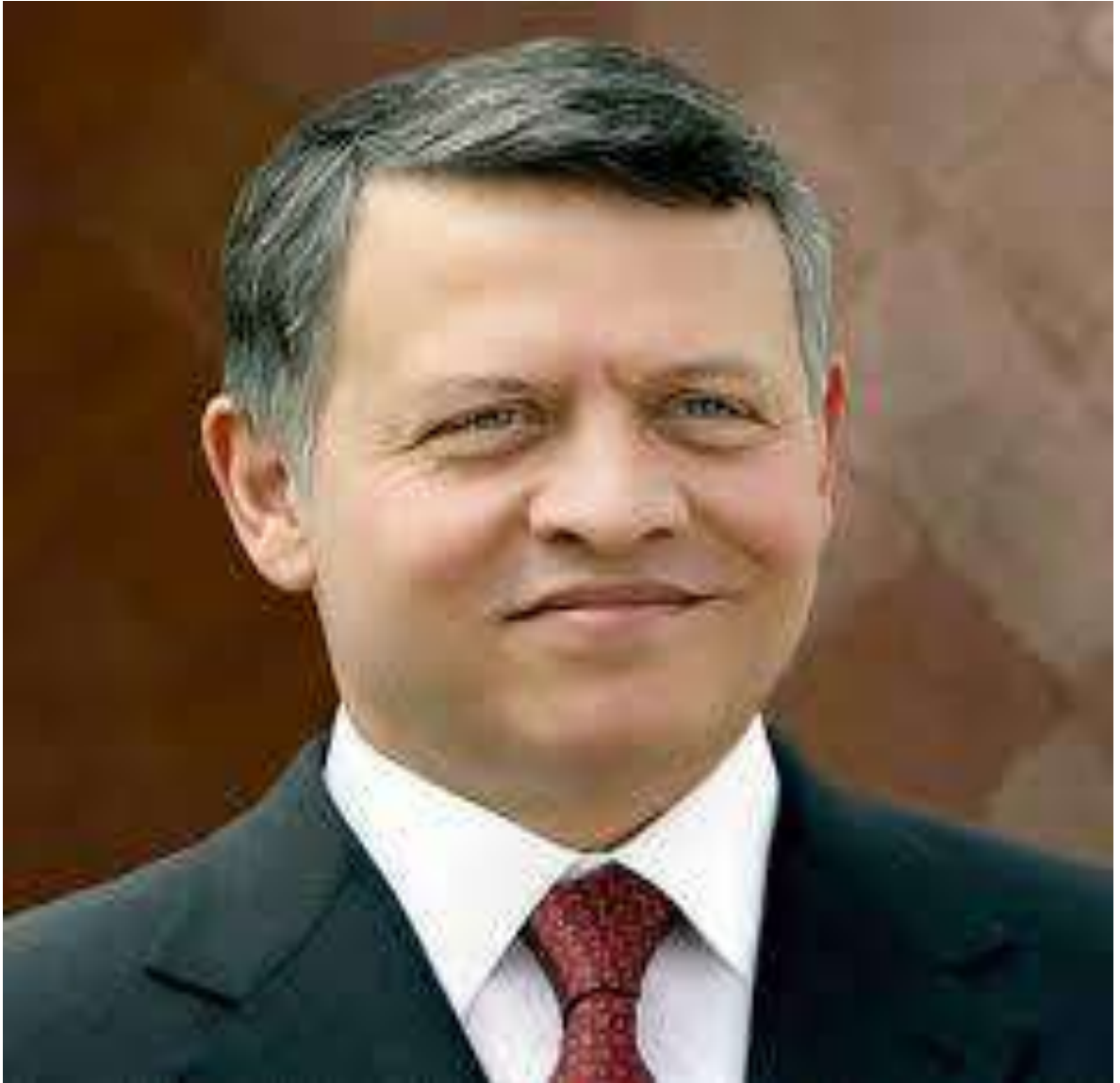
حضرة صاحب الجلالة الملك عبد الله الثاني بن الحسين المعظم