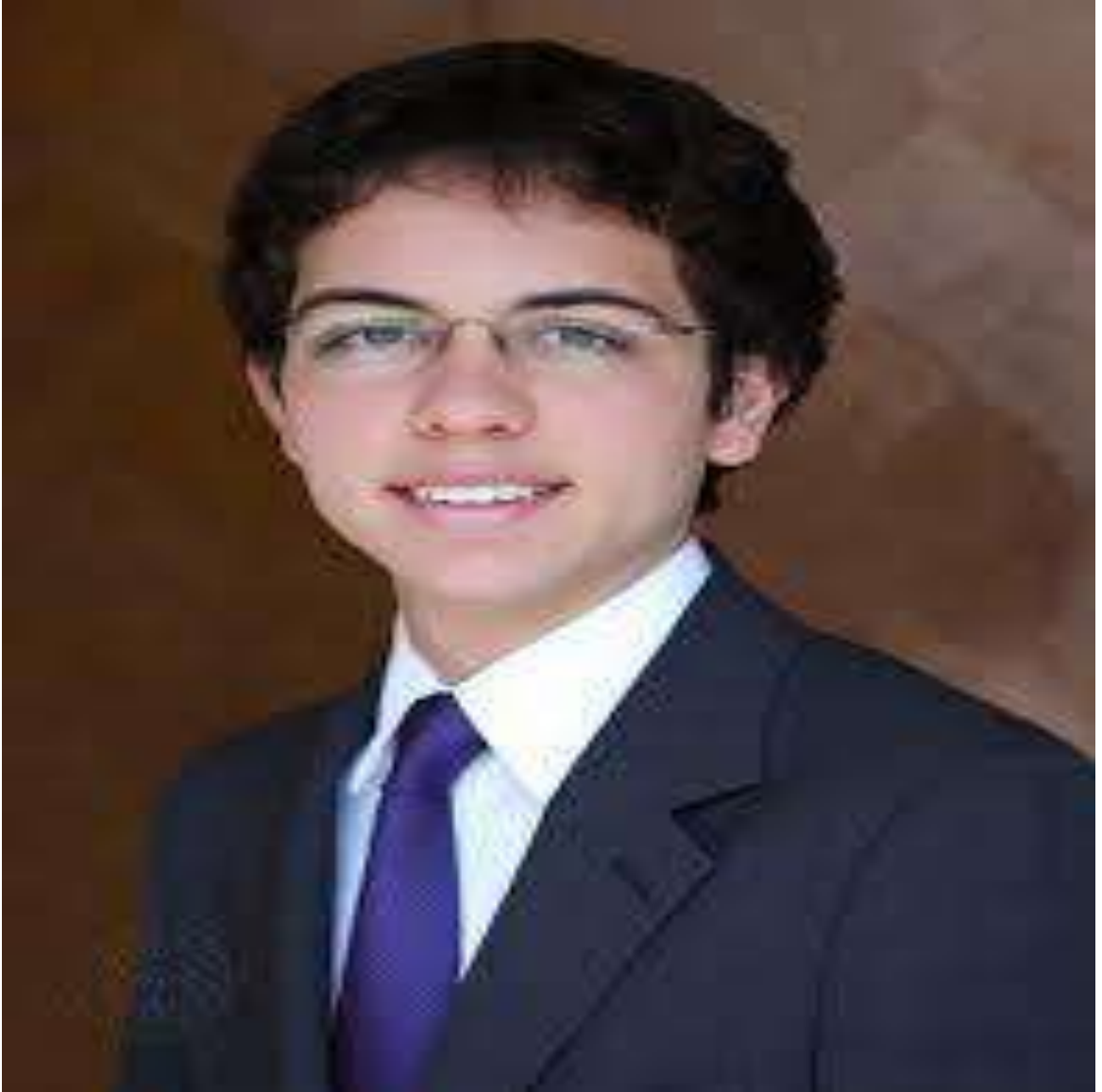
صاحب السمو الملكي الأمير الحسين بن عبد الله الثاني ولي العهد المعظم