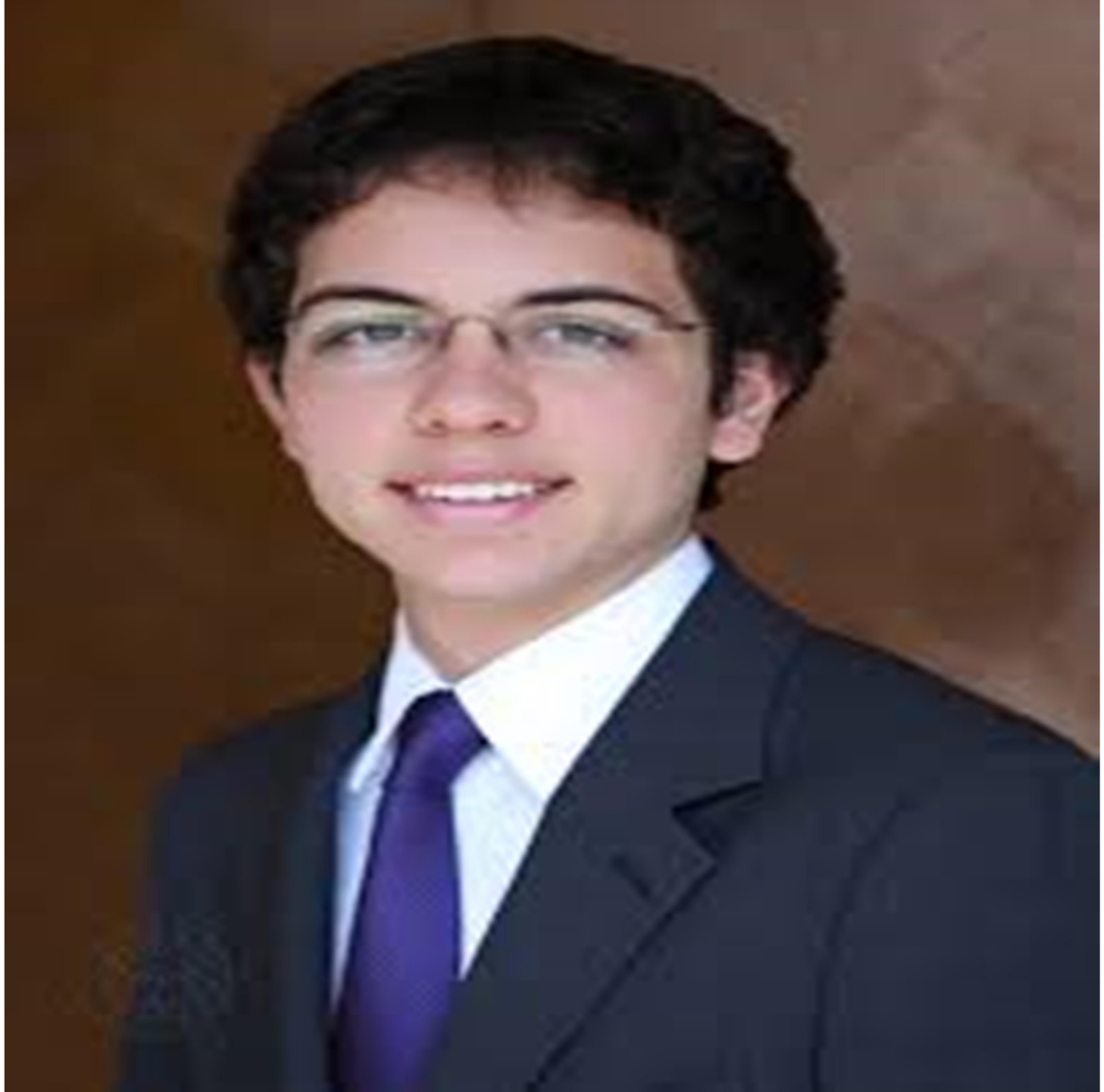
صاحب السمو الملكي الأمير الحسين بن عبد الله الثاني ولي العهد المعظم